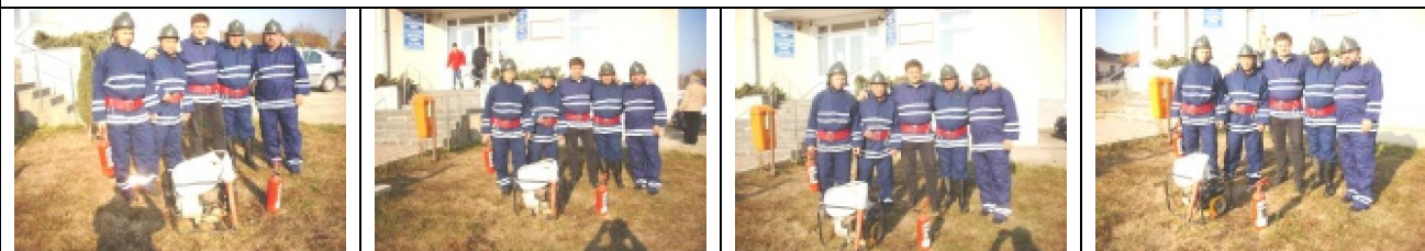
FOTO GRUP SVSU SUPLACU DE BARCAU